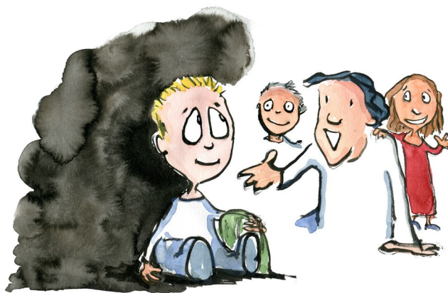
Det er vigtigt at alle føler sig set