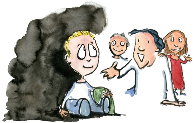
Det er vigtigt at alle føler sig set